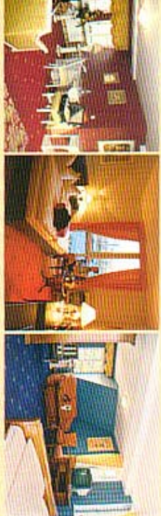
Christiane-Whippius-Suite Richard Wagner-Zimmer Goethe-Suite

Das Kurpark-Hotel befindet sich direkt an den Historischen Kuranlagen. Alle Zimmer sind in einem dem Kurpark entsprechenden Ambiente, spätbarock bis klassizistisch, eingerichtet.